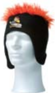
PETE PATRUUNA -pörröpiipo 12 €