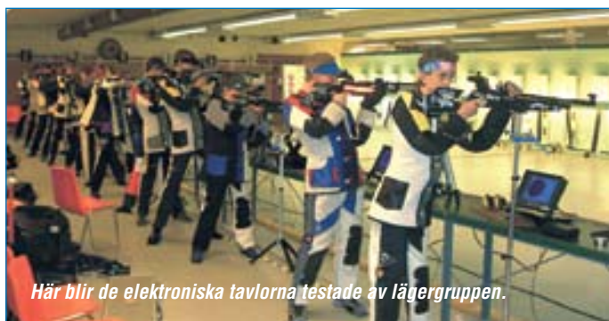
Här blir de elektroniska tavlorna testade av lägergruppen.