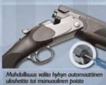
Mahdollisuus valita hylyn automaattinen ulosheitto tai manuaalinen poisto