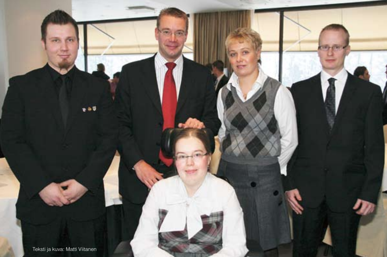
Teksti ja kuva: Matti Viitanen