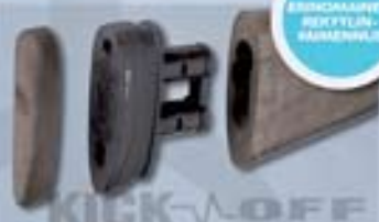
Kick-Off® vähentää rekylyn tuntua