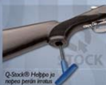
Q-Stock® Helppo ja nopea perin irrotus