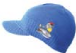
PETE PATRUUNA -lippapipo 12 €