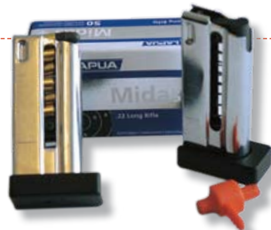
Morinin tankolippaaseen menee kuusi patruunaa. Punainen kappale toimii "klikkipatruunana".

Pistoolissa on anatominen, karhennettu Morinin kahva. Kämmentsyrjän tukea säädetään löysäämällä kaksi ruuvia (kuusiokolo 3 mm AV = avainväli). Kahvaa voidaan säätää kaikkiin kulmiin, kunhan kahva ensin irrotetaan (kuusiokolo, 6 mm AV). Tällöin voidaan kiertää neljää rungossa olevaa ruuvia ulospäin. Nämä painavat kahvan sisällä olevaa